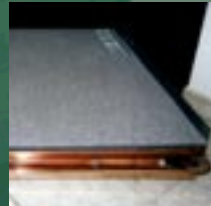
Komplettsysteme für Fußböden

Wir verstehen uns als ein überwiegend im Kundenauftrag tätiges Industrieunternehmen.